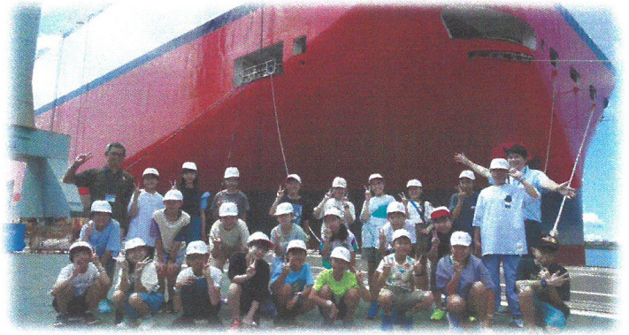
5年生 工場見学 (トヨタ自動車・新来島造船所)