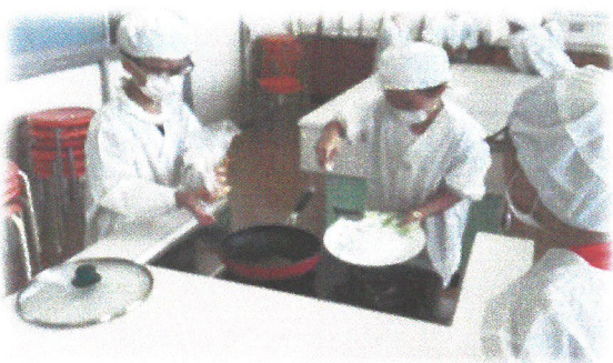
2年生 ポップコーン作り