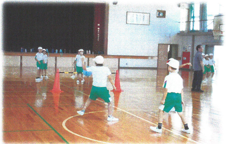
3年生 体育「プレルボール」

※バーをはさんで、ワンバウンドさせて味方にパスをしたり、相手がとりにくいボールを打ち返したりして得点を競い合う。