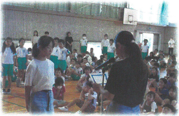
児童集会 各委員会の成果発表