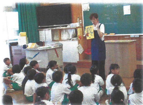
図書ボランティアさんによる読み聞かせ