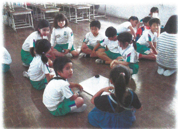
全校 たて割り班 平尾っ子タイム

ずっと続いた暑さも今週に入り、やっとやわらいできました。学校生活のリズムも取り戻し、毎日の学習や活動に意欲的に取り組んでいる子どもがたくさんいます。子どもたちの元気な声や笑顔があってこそその学校だと改めて感じます。今年は、熱中症等の危険を鑑み、運動会の実施を遅らせて、10月26日（土）を予定しています。来週から運動会に向けて、練習が始まります。練習にしっかり取り組めるように、生活リズムを整え、睡眠をたっぷりとり、体操服やお茶の用意や励ましもよろしくお願ひします。