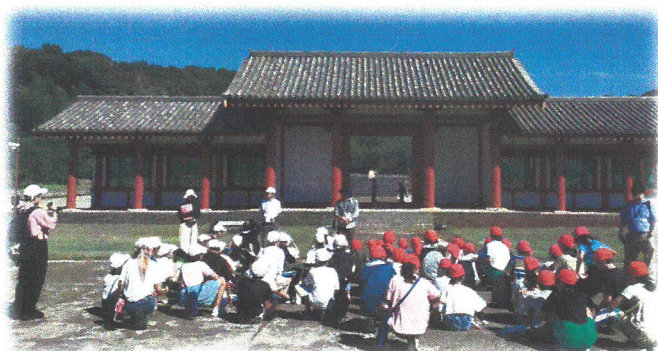
6年生 国分尼寺・平和公園見学