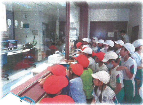
4年生 清掃工場見学